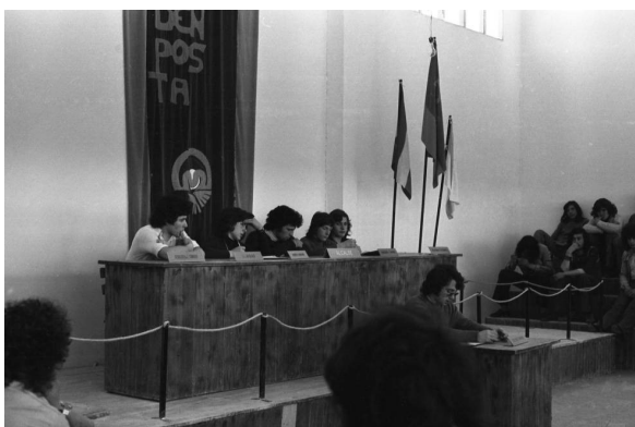
Parlamentul democratic al „Republicii copiilor” - apărut cu douăzeci de ani înainte ca Spania să fi avut un parlament democratic...

Funcționa de asemenea o televiziune proprie (în realitate o instalație video, la vremea aceea destul de scumpă de altfel) și un post de radio (de fapt stație de amplificare cu difuzoare în fiecare încăpere).