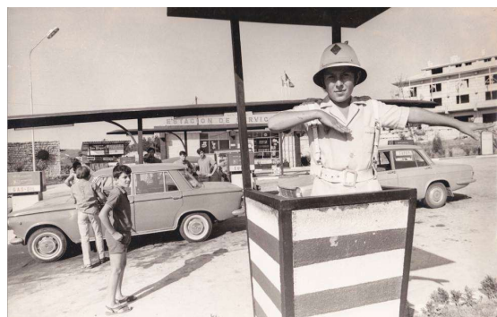
Pompa de benzină și un copil-polițist din Benposta, în uniformă, conducând circulația

Se afirmă că Benposta a reușit o bună perioadă de timp să se autofinanțeze. Dispunea de o bancă proprie și de un „sector productiv” propriu, respectiv de o serie de ateliere protejate, care reprezentau „industria” statului. În plus cunoscutul „circ al copiilor” aducea la rândul lui (cel puțin în deceniile șase și șapte ale secolului trecut, când spectacolele de circ erau la modă și se bucurau de un public destul de numeros) venituri deloc negliabile.